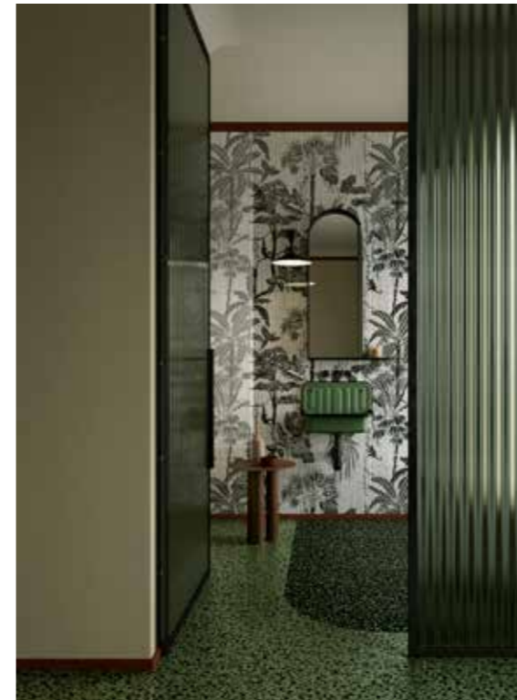
IMAGES PAG.014 Journey Black 120x280 Sodaislab 6 Specchio