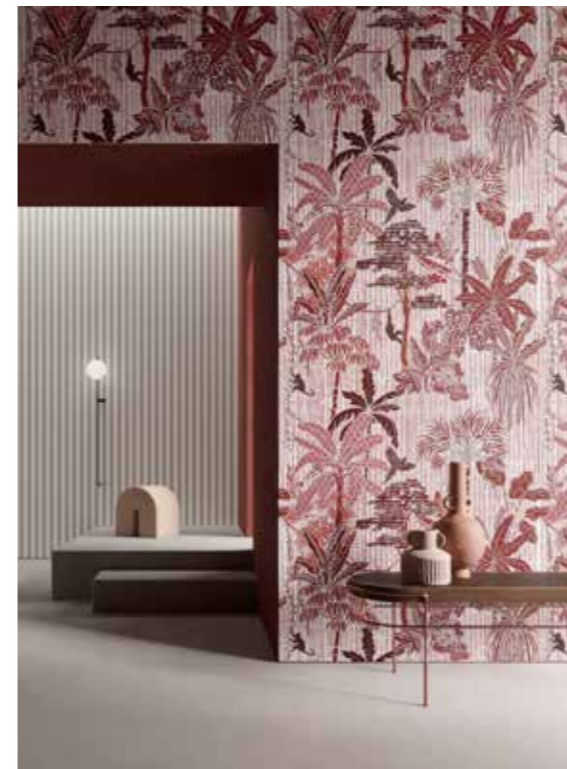
IMAGES PAG.017 Journey Red 60x120 SodaiSlab 6 Treddi