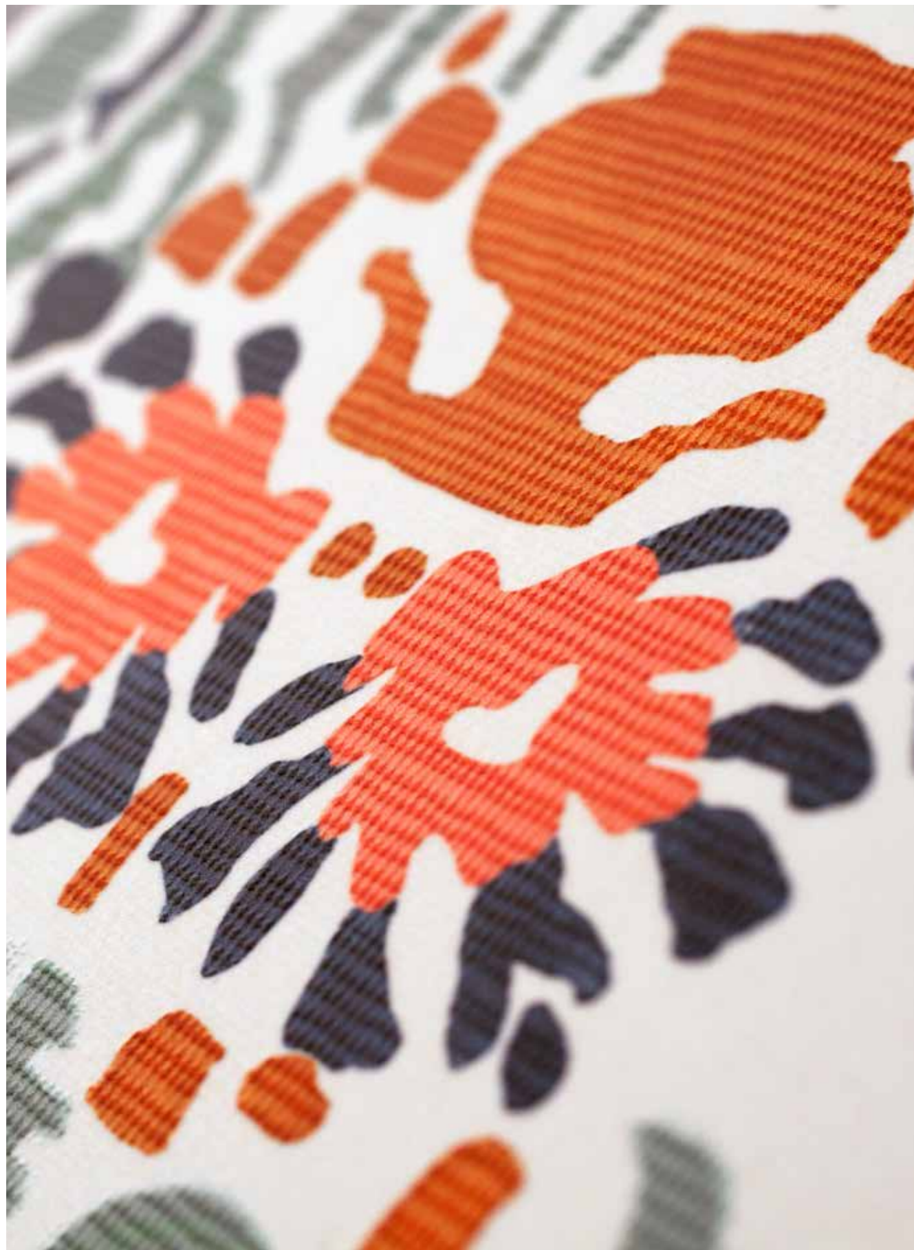
DETAIL - SodaSlab 6 Treddi