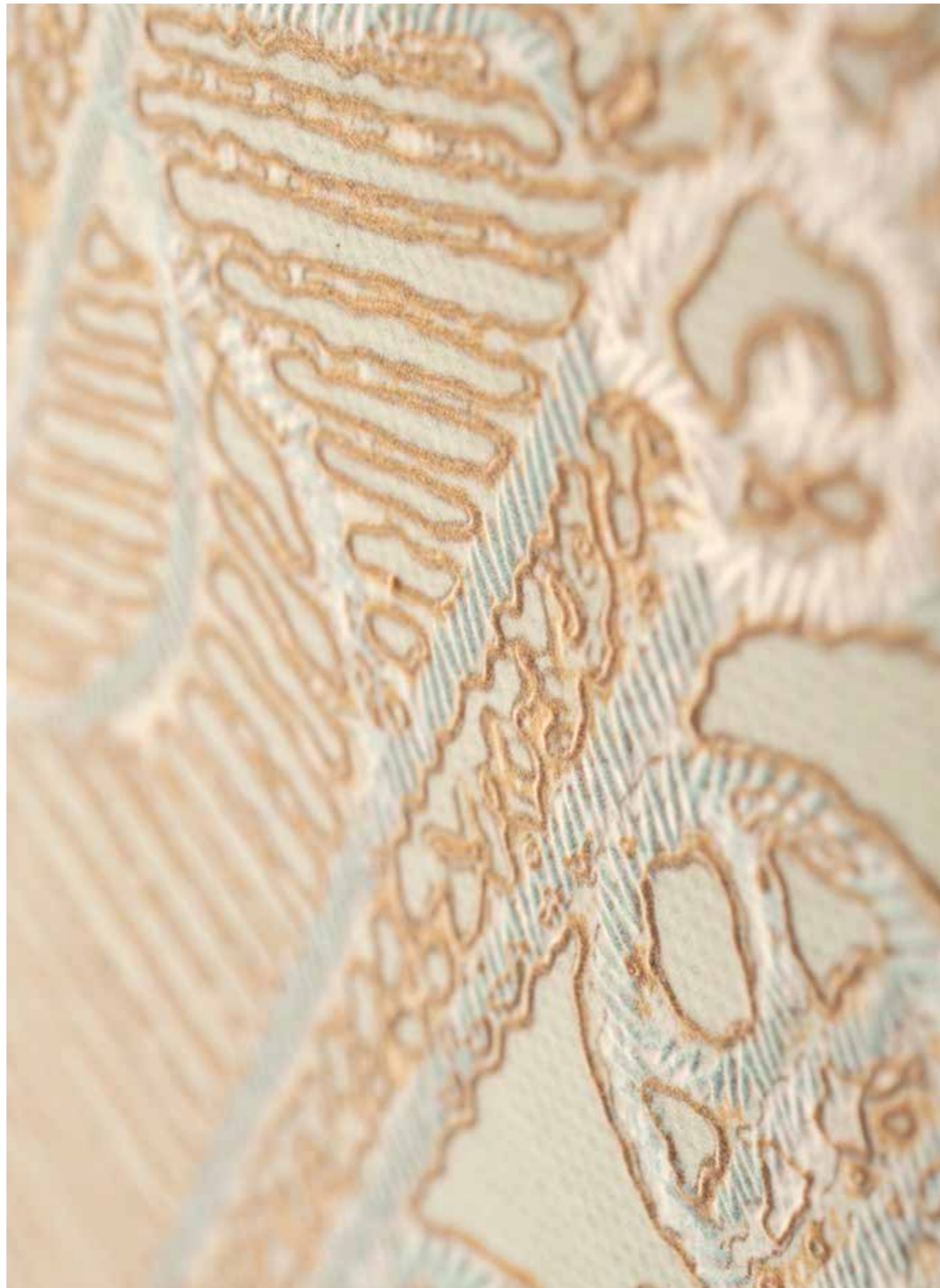
DETAIL - SodaiSlab 6 Treddi