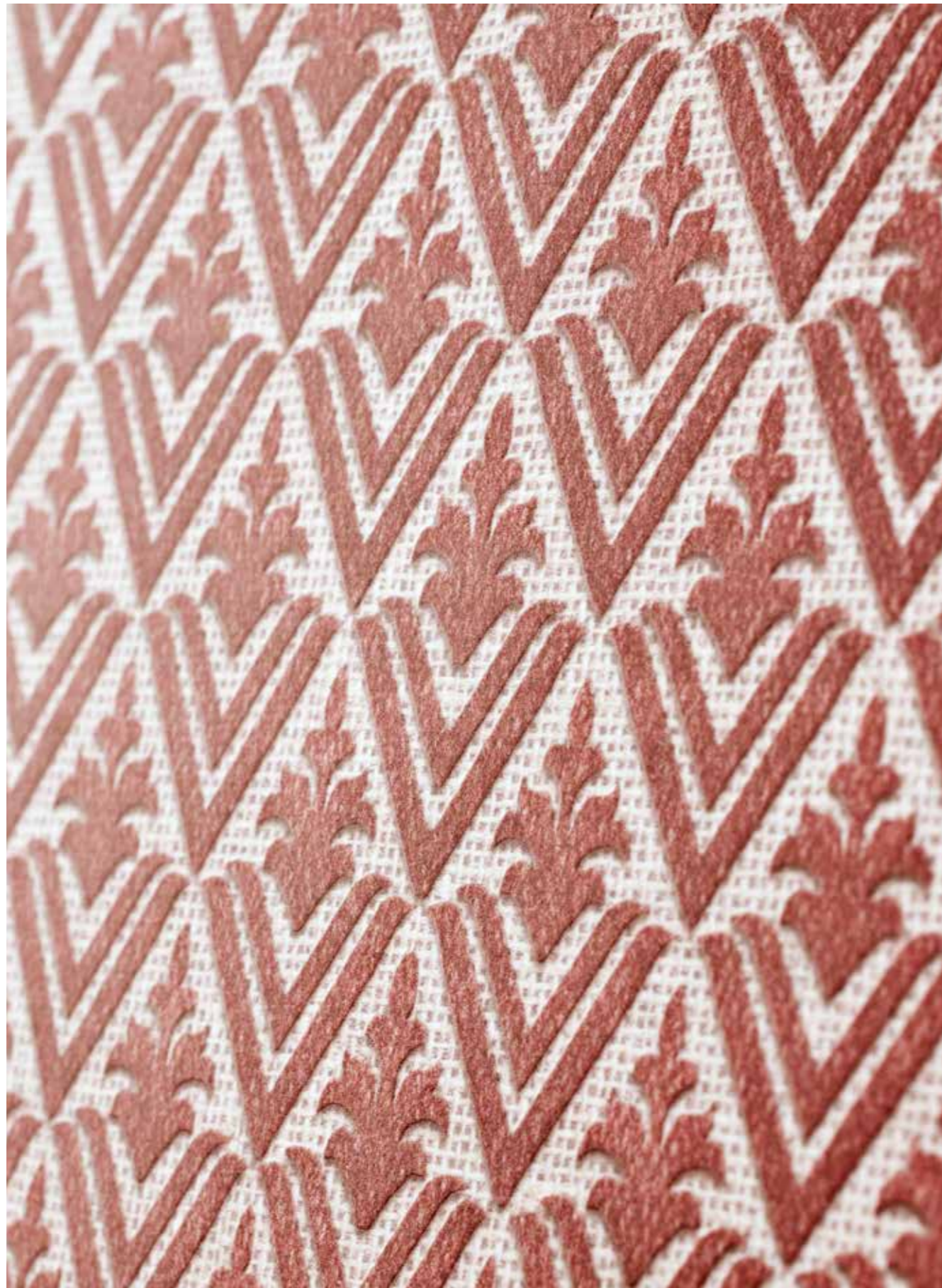
DETAIL - SodaSlab 6 Treddi